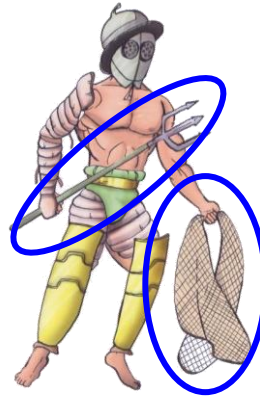
Error traci: trident, xarxa.