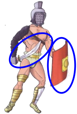
Error samnita: escut petit, espasa llarga.